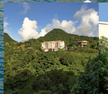
La Tranchée à Fonds St Denis