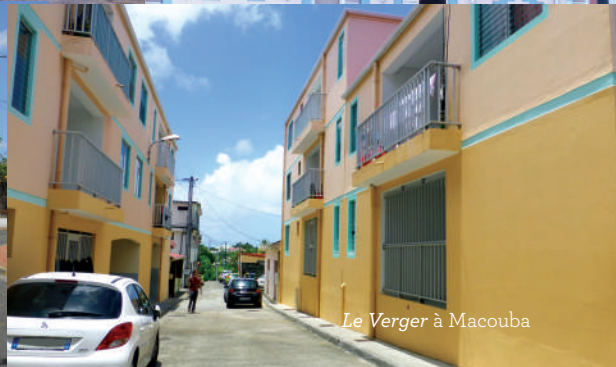
Le Verger à Macouba