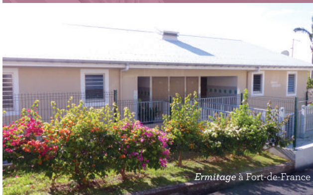
Ermitage à Fort-de-France