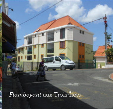
Flamboyant aux Trois-Îlets