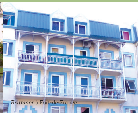
Brithmer à Fort-de-France