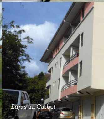
Lajus au Carbet