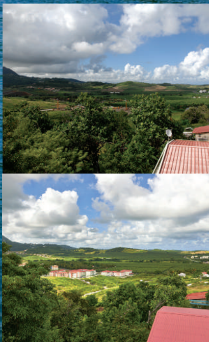
Hibiscus-Sigy au Vauclin (avant/après)