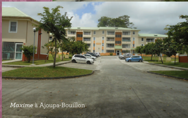
Maxime à Ajoupa-Bouillon