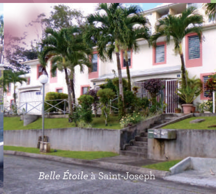
Belle Étoile à Saint-Joseph