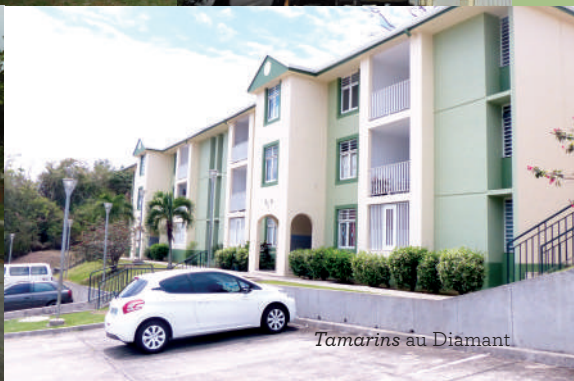
Tamarins au Diamant