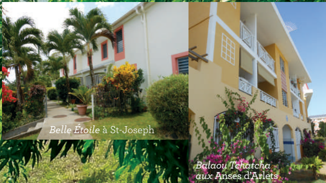
Belle Étoile à St-Joseph

Des listes peuvent être mises à disposition.