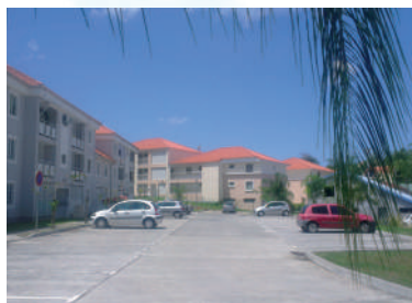
Coma aux Trois-Îlets