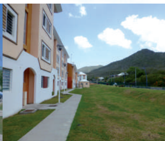
Balaou Tchatcha aux Anses d'Arlets