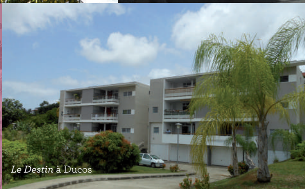
Le Destin à Ducos