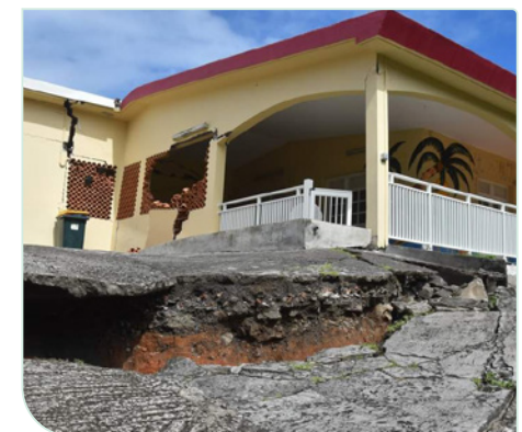
Mouvement de terrain -Sainte-Marie