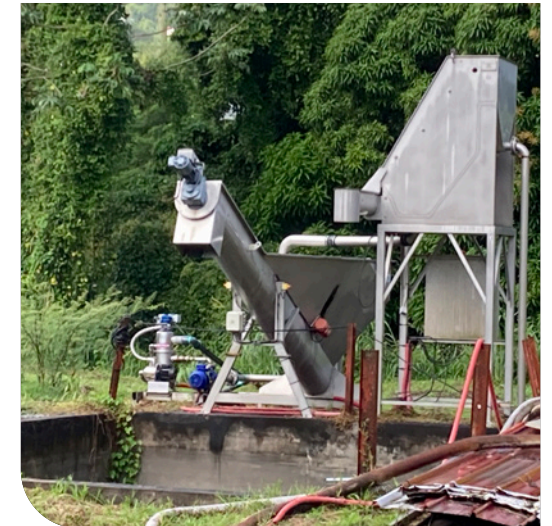
iCPE La Mauny

104 réceptions à titre isolé de véhicules.