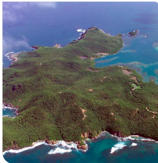
Réserve naturelle de la Caravelle

Inscrite à la stratégie nationale pour les aires protégées 2030, l'extension marine de cette réserve vise à protéger la baie du Trésor pour son intérêt pa-