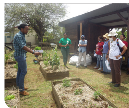
Eco-quartier jardin agri urbain