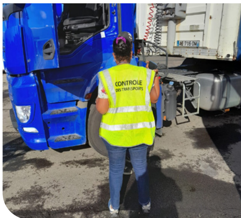
Contrôle des transporteurs

Les infractions liées à la réglementation sociale européenne (temps de conduite et de pause) et à la réglementation des transports (défaut d'inscription au registre des transports, absence de la copie conforme de la licence à bord du véhicule) représentent la grande majorité des infractions (70%). Elles sont en baisse de 12% par rapport à 2021, évolution liée en partie à la récente adaptation locale de la réglementation relative aux temps de