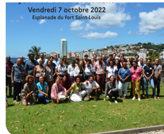
Journée des associations