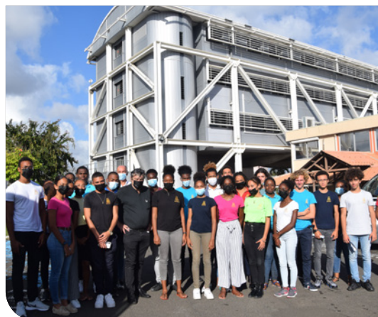
Rencontre DEAL et étudiants