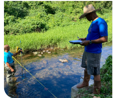
Station hydrométrique de Rivière-Salée

La DEAL a réalisé près de 27 km de travaux d'entretien des cours d'eau (régie et travaux d'entreprises utilisant des moyens mécaniques importants), soit une augmentation notable par rapport à l'année 2021 et environ 12 km de travaux d'élagage et de débroussaillage. Dans la continuité des démarches engagées ces trois dernières années, les protocoles d'intervention des équipes terrain intègrent, dès le montage des projets, la sensibilité du milieu, avec un souci permanent d'efficacité, mais aussi de respect de l'environnement.