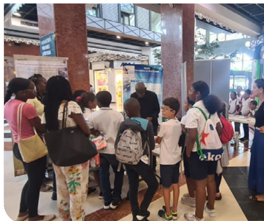
Journée nationale résilience