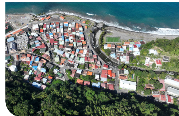
Anse des galetst

L'année 2022 aura par ailleurs été marquée par la réalisation d'une séance d'information/formation à destination de l'ensemble des communes de la Martinique. Cette journée organisée en partenariat avec la magistrature en charge du traitement des infractions relevées au titre du code de l'urbanisme a permis de rappeler le rôle prépondérant du maire dans la lutte contre les constructions il-