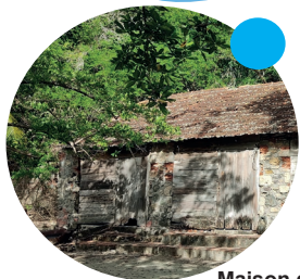
Maison du pêcheur