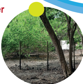
Site de ponte