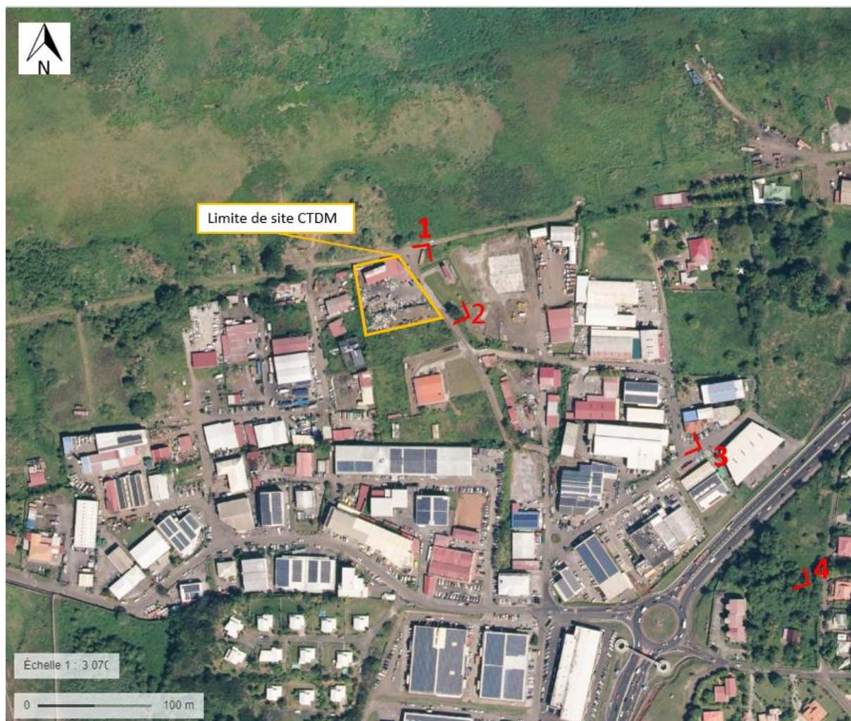
Figure 1 : Localisation des prises de vue

Ce document correspond à l'annexe n°3 de la demande au cas par cas réalisée pour le projet de traitement de déchets dangereux sur le site CTDM. Il s'agit ici de situer le projet dans l'environnement proche et le paysage lointain par des photos. La figure ci-dessous localise les prises de vue effectuées. Les photos en pages suivantes ont été prises en date du 14 juillet 2022.