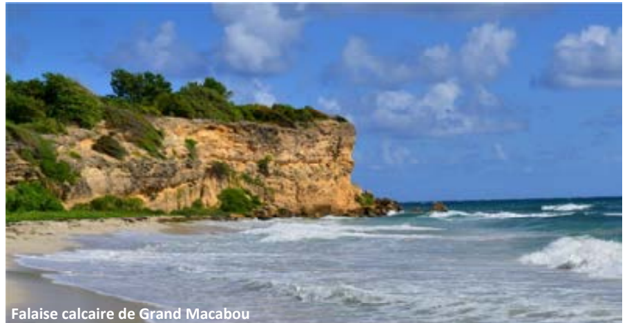
Falaise calcaire de Grand Macabou