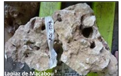
Lapiaz de Macabou 3

La dissolution de ces roches carbonatées par les pluies produit des figures d'érosion tourmentées appelées lapiaz, rascles et localement calcaires à ravets.