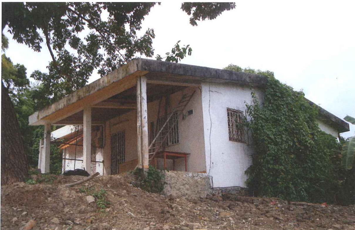
Vue d'ensemble avec sur la gauche la façade comportant un soubassement en pierres.