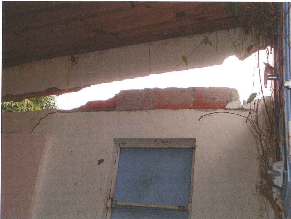
Exemple de désordre observable en tête de certains murs.