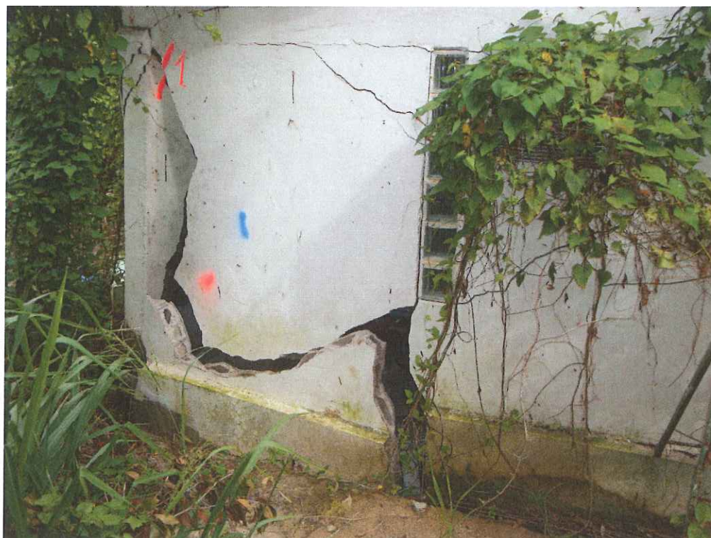
Désordres importants sur une façade dans l'angle en diagonale de celui visible sur la photo précédente.