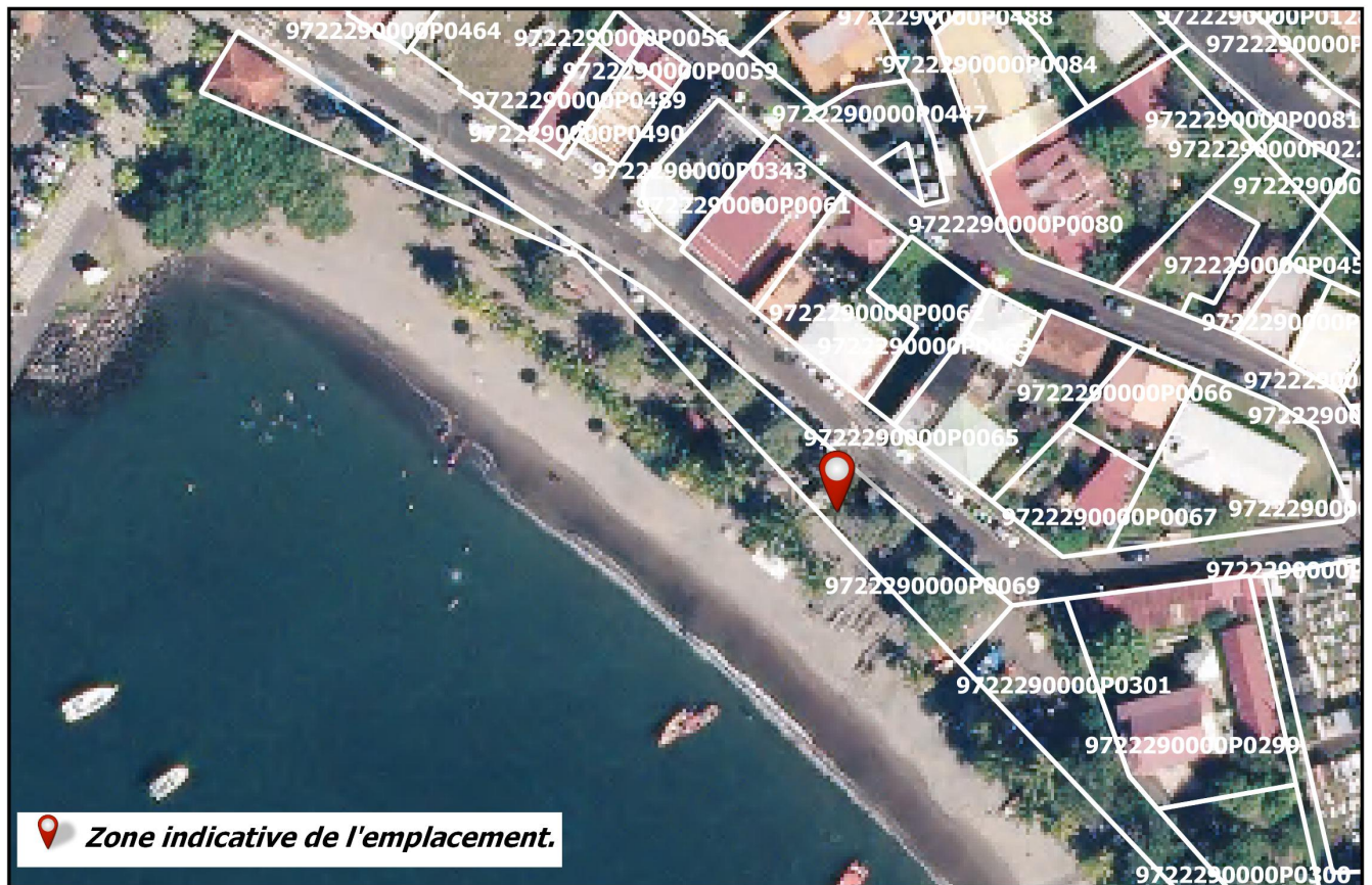
Bourg Commune de SCHOELCHER