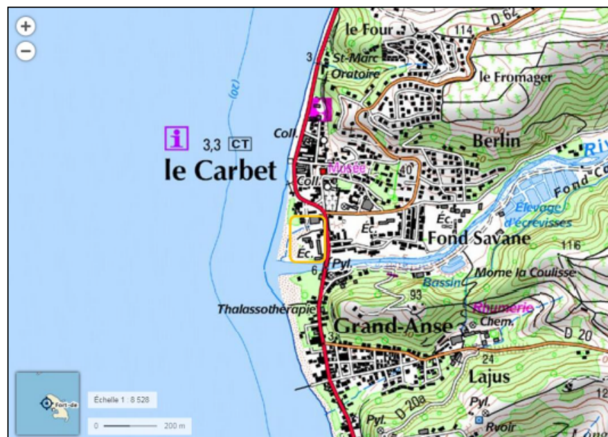
Figure 3: Localisation du site de projet

La commune du Carbet a prescrit la modification n°1 de son PLU afin de permettre la réalisation d'un village d'activités situé à l'entrée du bourg, au lieu dit « Grand Anse Nord », sur le site de l'ancienne école élémentaire mixte B, au droit des parcelles cadastrées A84, A240 et 241, A589 à 591 et A593.