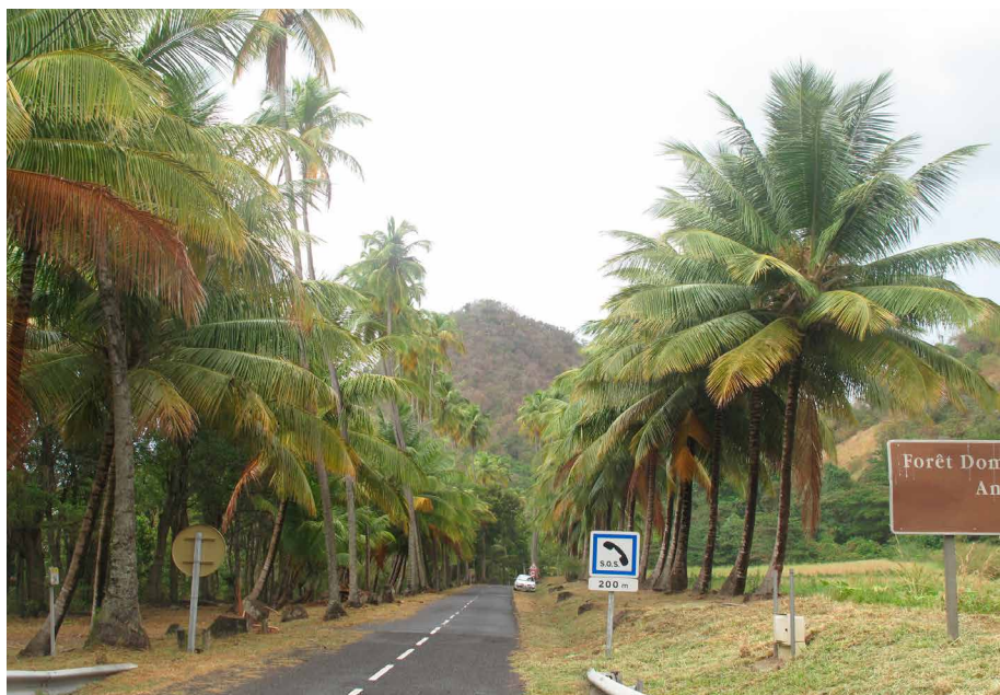
À droite de l'allée de cocotiers se trouve la parcelle Plateau l'allée