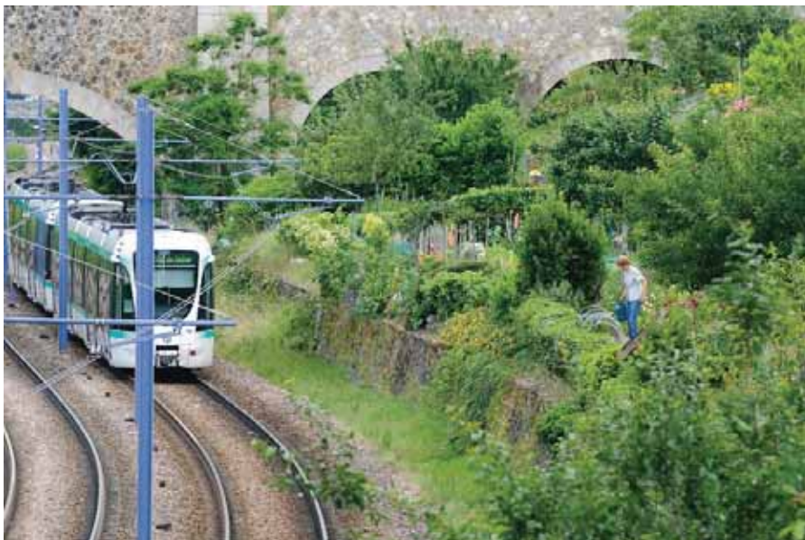
Développer les jardins partagés