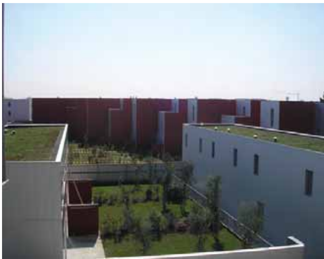
Toitures végétalisées dans l'EcoQuartier de la Bottière-Chêne à Nantes

La question de la nature en ville suscite la réflexion sur les formes urbaines, les liens entre densité et nature, les pratiques d'aménagement et de construction en extension ou en renouvellement urbain, l'innovation dans la récupération et le stockage des eaux pluviales pour les usages collectifs, la végétalisation des surfaces horizontales et verticales pour réduire notamment le phénomène d'îlot de chaleur, etc.