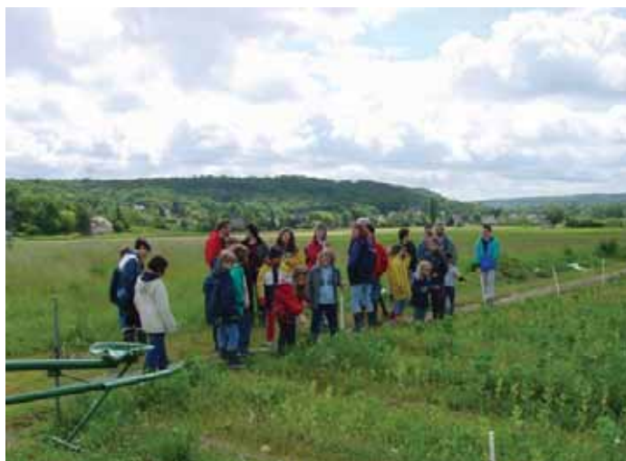
Sensibilisation d'un groupe scolaire à l'agriculture péri-urbaine - Le Triangle Vert

Une meilleure appréhension et compréhension du jeu de leurs demandes, de leurs tolérances et de leurs rejets de la nature en ville est un préalable.