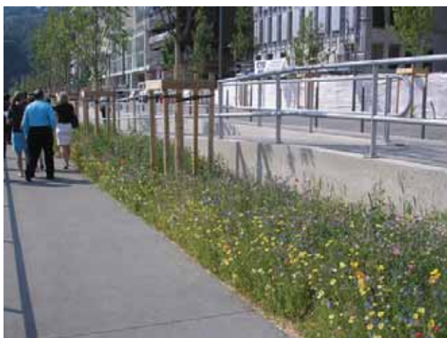
Mail piéton bordé d'une prairie fleurie dans l'EcoQuartier de Lyon-Confluence - Meddtl