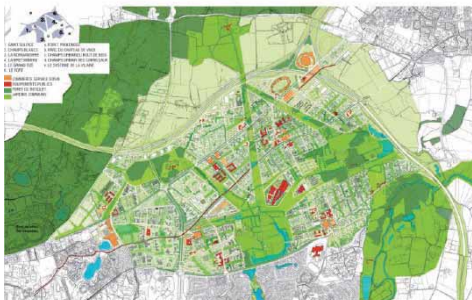
La trame verte et bleue dans le projet d'ÉcoCité de Rennes - Projets urbains Devillers associés