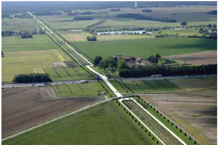
L'Allée Royale de Sénart réinvente la campagne - Agence Laverne

Chaque année en France, plus de 85 000 ha de terres agricoles incluant des espaces naturels, sont transformés en routes, habitations, zones d'activités, et ce rythme s'accélère fortement. Le maintien des activités et paysages d'une agriculture urbaine et péri-urbaine (plus du tiers des exploitations agricoles), la protection et la valorisation du patrimoine forestier et de ses lisières, sont des enjeux majeurs aux plans social, économique, écologique, et pour une gestion durable de territoires mêlant ville et campagne. Les espaces agricoles sont le support de fonctions écologiques, économiques et sociales (production d'aliments, de biomasse, d'Éco-matériaux, épuration des eaux, fonctions paysagères, animation de territoires...), et l'agriculture a en charge leur gestion.