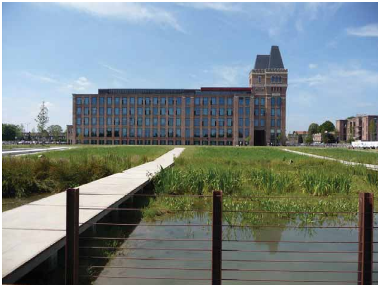
Le jardin d'eau dans l'ÉcoQuartier des rives de la Haute-Deûle – MEDDTL