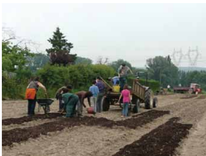
Usage du bois raméal fragmenté pour fertiliser les sols sur la commune de Marcoussis - Le Triangle Vert

Longtemps ignorés dans leur dimension écologique, les sols urbains sont très altérés par les activités humaines (extension spatiale des villes, aménagements urbains, infrastructures de transports, certaines pratiques de l'agriculture, pollution industrielle, etc.) et leurs caractéristiques dépendent de