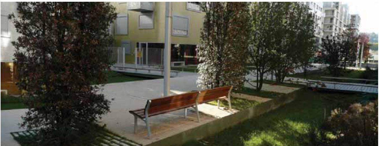
Jardins en creux pour une gestion de l'eau à la parcelle à Boulogne-Billancourt - Agence Laverne

Action 10.3 : Lancer un appel à projets de valorisation des zones humides en milieu urbanisé.