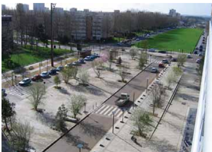
la campagne en ville : projet d'un verger urbain avenue de Fréville à Rennes - Agence Laverne

Tous les espaces de nature ont des fonctions et rendent des services différents selon leurs caractéristiques propres. Dans la mesure où ceux-ci sont complémentaires, il convient, pour mieux répondre aux enjeux écologiques et d'urbanité, de les articuler à toutes les échelles du territoire de la ville, dans tous les contextes urbains (en extension, en renouvellement, en périurbain...) et d'assurer leur bonne gestion.