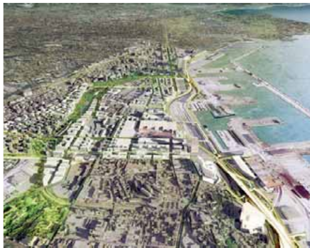
Projet d'EcoCité à Marseille - Euroméditerranée

Les appels à projets ÉcoQuartiers et démarche ÉcoCités de l'État vont donc encourager les réalisations ambitieuses et novatrices dans ces champs et de nouveaux critères de sélection et de distinction relatifs à la nature en ville seront élaborés, en cohérence avec l'actualisation du cadre de référence agenda 21 et le référentiel de la ville durable européenne.