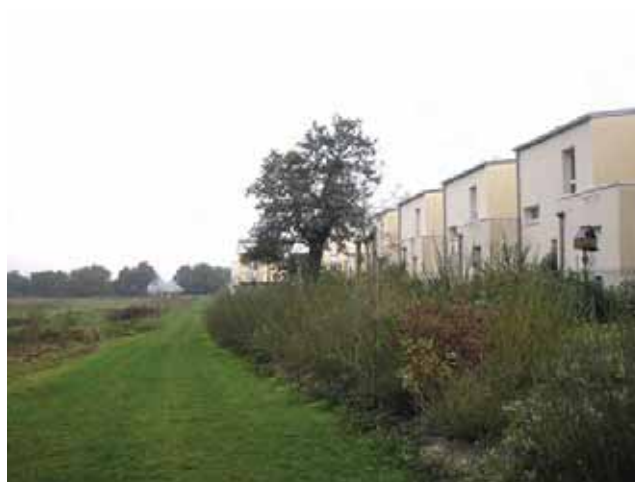
Gestion différenciée des espaces de nature dans l'EcoQuartier de La Chapelle-sur-Erdre - Meddtl

Il convient également de développer les pratiques écologiques dans les espaces privés et de perfectionner les connaissances sur les sols urbains pour mieux comprendre leur fonction de régulation de l'eau et en dégager des clés de gestion.