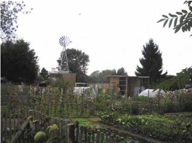
Des jardins familiaux dans l'EcoQuartier de la Bottière-Chênaie à Nantes

Tous les espaces urbains n'appellent pas une végétalisation. Le renforcement de la nature en ville mérite d'être travaillé au cas par cas, selon le contexte écologique, la géographie des lieux et les vœux des habitants.