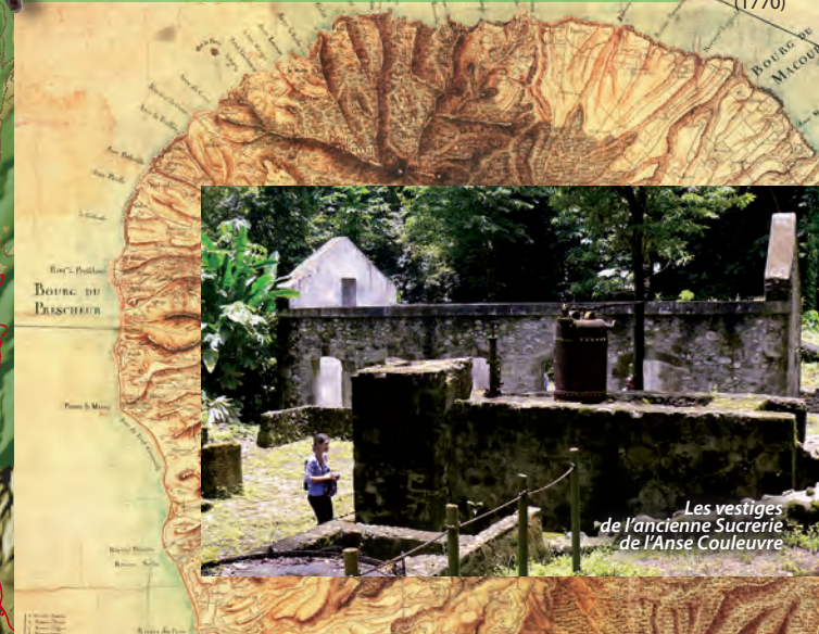
Les vestiges de l'ancienne Sucrière de l'Anse Couleuvre