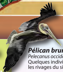
Pélican brun Pelecanus occidentalis Quelques individus fréquentent les rivages du site.

Le massif forestier est l'un des plus sauvages et inaccessibles de l'île. Le relief particulièrement abrupt l'a préservé des atteintes de l'homme et une bonne partie est constituée par de la forêt primitive. La nature y est exceptionnelle de par sa richesse, faisant de la Martinique un des Hot Spot de la planète (points chauds de la biodiversité mondiale). La richesse végétale au km 2 est 75 fois supérieure à celle de l'Hexagone.