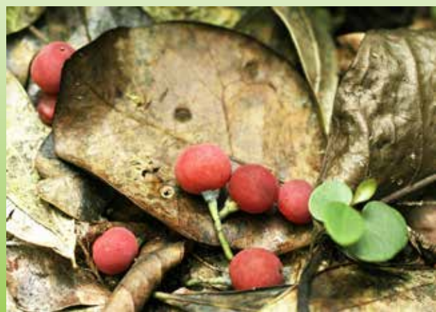
Morne La Fouquette Marin Fruits du Canella Winterana sur la litière de la forêt

Il s'agit donc d'un périmètre de ZNIEFF extrêmement précieux pour la Martinique au point de vue de la végétation. Il héberge les seules populations de Canella winterana existant sur l'île. Quelques îlots forestiers sont ce que l'on trouve de plus proche de l'ancien climax sempervirent saisonnier inférieur de Martinique. Les espèces rares que l'on y trouve sont très dynamiques et la biodiversité arborée globale est très élevée.