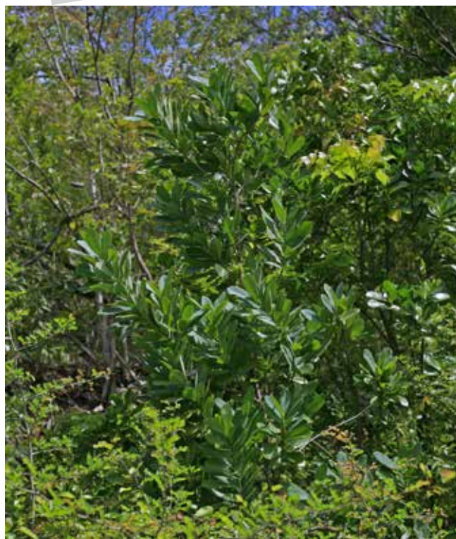
Bois cannelle ( Canella winterana )