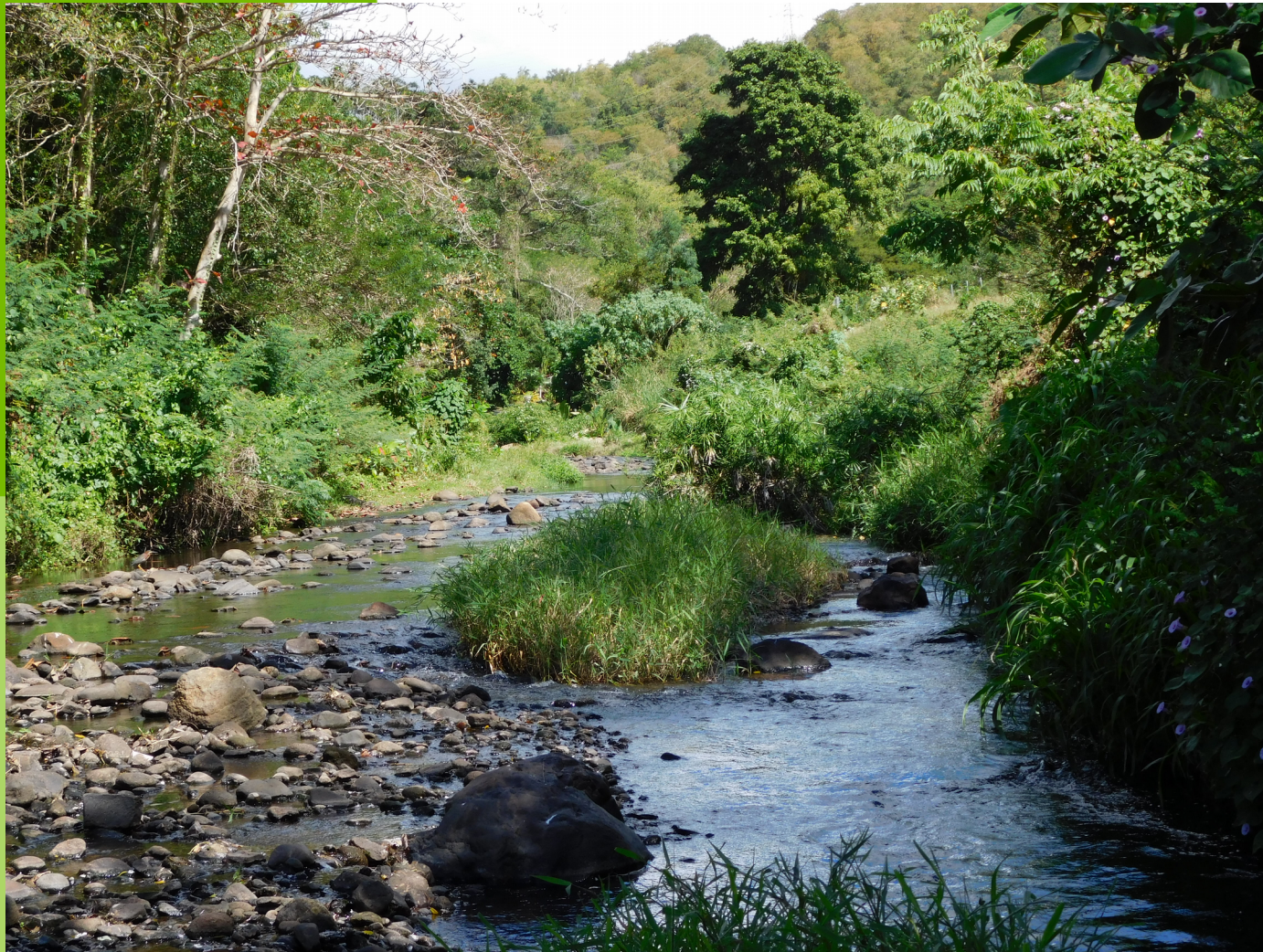
Rivière Case-Navire, février 2017, DEAL.