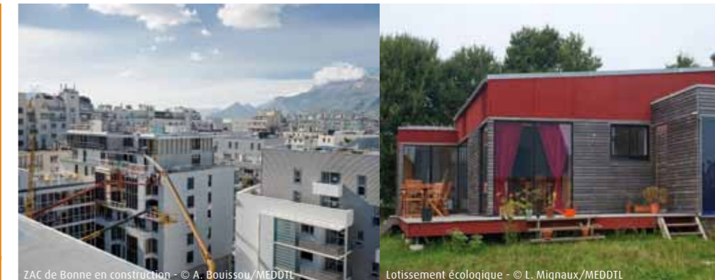
ZAC de Bonne en construction

Concernant le site internet ÉcoQuartier, sa fréquentation est en hausse depuis 2009 et une nouvelle version du site, intégrée au site du ministère du Développement durable, est prévue en 2011.