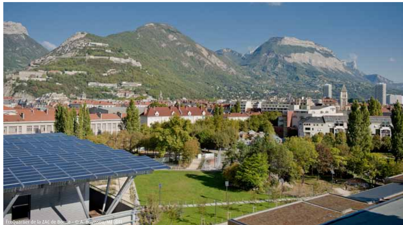
EcoQuartier de la ZAC de Bonne

jugera les plus exemplaires et les plus innovantes. Ces projets auront adopté une démarche transversale sur les enjeux du développement durable, proposé des innovations sur une ou plusieurs ambitions et conçu leur projet de quartier comme un levier vers la ville durable. La ministre du Développement durable annoncera le palmarès en septembre 2011.