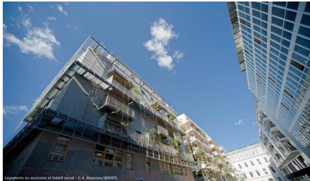
Logements en accession et locatif social - © A. Bouissou/MEDDTL