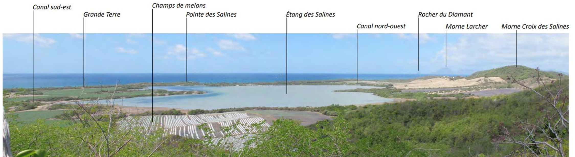
Vue sur l'Étang des Salines, depuis le morne des pétrifications